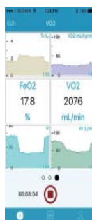
<vo2 master manager>